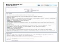
Evaluaciones de Desempeño