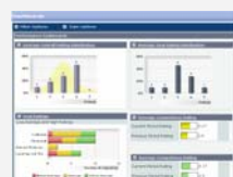
Informes y paneles de instrumentos

Con solamente un clic, los Informes y Paneles de Instrumentos le ayudan a su organización a monitorear el progreso en relación con los objetivos de su empresa, y a identificar y resolver las brechas en las habilidades y competencias.