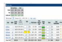
Planificación de Compensación